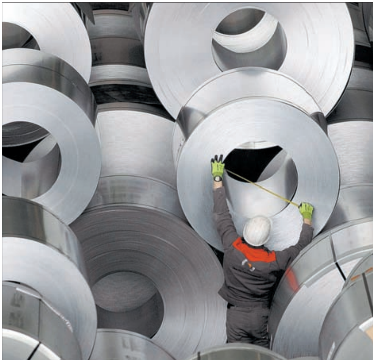
Stahlrollen werden vermessen – immer häufiger im Ausland.

Welche Trends beobachten Sie bei den Zielregionen der Verlagerungen und bei den Branchen?